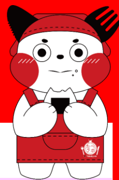
熊本県立大学 食育PRキャラクター 「もぐ丸」